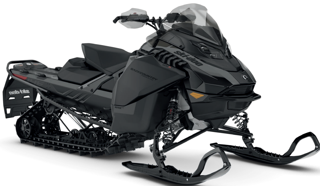
BACKCOUNTRY ADRENALINE 600R E-TEC VISAS